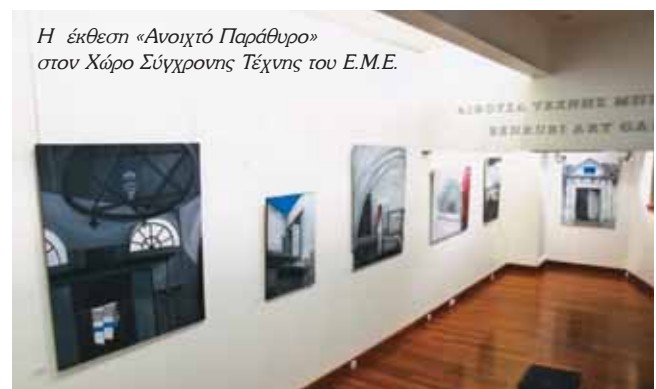
Η έκθεση «Ανοιχτό Παράθυρο» στον Χώρο Σύγχρονης Τέχνης του Ε.Μ.Ε.