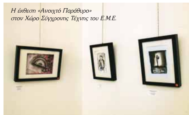
Η έκθεση «Ανοιχτό Παράθυρο» στον Χώρο Σύγχρονης Τέχνης του Ε.Μ.Ε.

τα εγκαίνια της έκθεσης «Ανοιχτό Παράθυρο» στον Χώρο Σύγχρονης Τέχνης του Ε.Μ.Ε., ενώ κάποια από τα έργα της καλλιτέχνης διατέθηκαν στη Συναγωγή Ετς Χαΐμ, με στόχο την ενίσχυση και αποκατάσταση του μοναδικού αυτού μνημείου για την ιστορία των ελλήνων εβραίων.