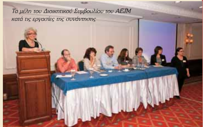
Τα μέλη του Διοικητικού Συμβουλίου του ΑΕJM κατά τις εργασίες της συνάντησης

Η επαφή των συνέδρων με τους θησαυρούς της ελληνοεβραϊκής ιστορίας και παράδοσης έδωσε την αφορμή να συζητηθούν κατά τις επόμενες ημέρες, με τη μορφή εργαστηρίων, ζητήματα όπως η διαχείριση της συλλογής, ο σχεδιασμός των περιοδικών εκθέσεων, η προληπτική συντήρηση, οι εκπαιδευτικές δράσεις, καθώς επίσης και ερευνητικά προγράμματα που υλοποιούνται από το Ε.Μ.Ε., όπως το corpus των εβραϊκών επιγραφών. Το Μουσείο, ως μέρος της διοργάνωσης, σχεδίασε ξενάγηση σε μνημεία και τόπους εβραϊκού ενδιαφέροντος στην Αθήνα. Η ξενάγηση συνεχίστηκε στη Χαλκίδα, με