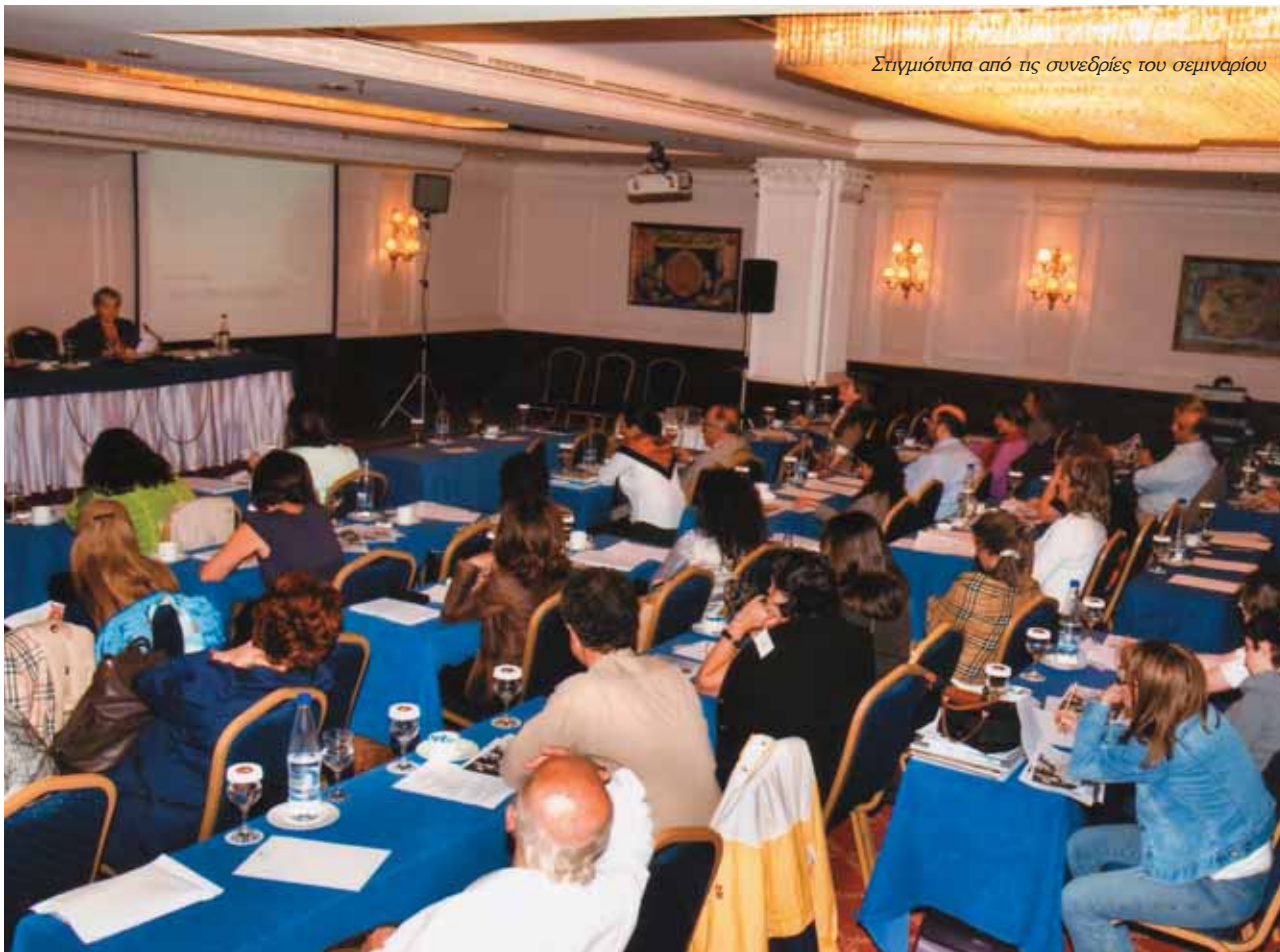
Στιγμιότυπα από τις συνεδρίες του σεμιναρίου

νιστικούς χρόνους και την άφιξη των ισπανοεβραίων το 1492. Περιγράφοντας το πλαίσιο των σχέσεων μεταξύ ελληνικής και εβραϊκής διασποράς ανά τους αιώνες, κατέδειξε τη συνθήως αρμονική αλλά και κάποιες φορές δύσκολη συνύπαρξη των δύο λαών, καθώς και τις ιστορικές διαδικασίες μέσα από τις οποίες οι εβραίοι αναδείχθηκαν σε οικονομικούς και κοινωνικούς παράγοντες.