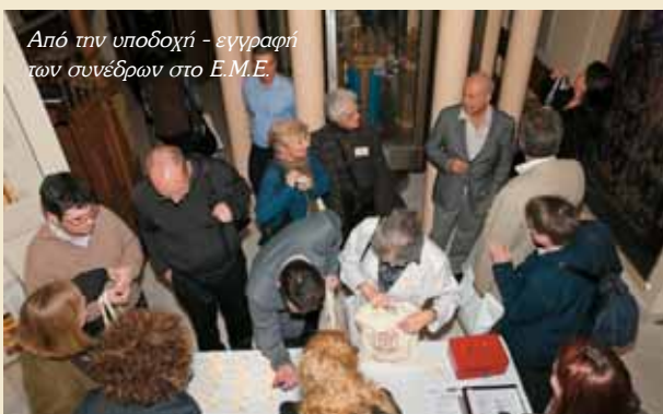
Από την υποδοχή - εγγραφή των συνέδρων στο Ε.Μ.Ε.