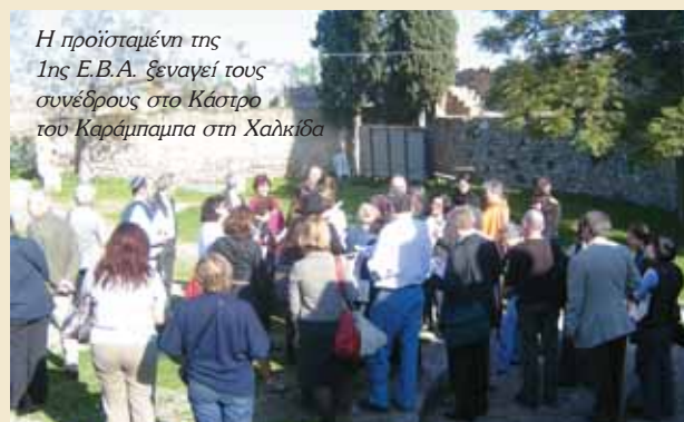
Η προϊστάμενη της Ιης Ε.Β.Α. ξεναγεί τους συνέδρους στο Κάστρο του Καράμπαμπα στη Χαλκίδα